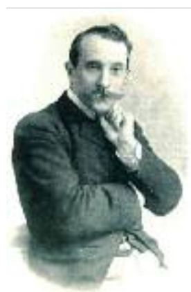
Foto d'epoca di Nunzio Nasi